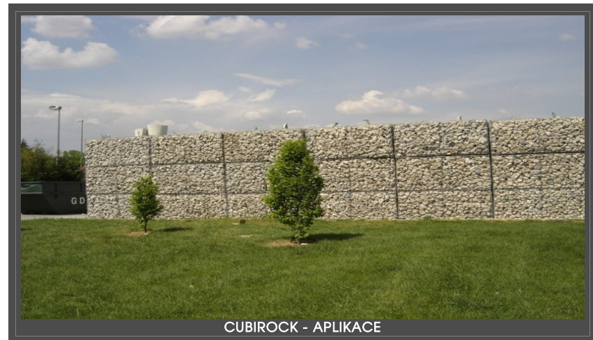
CUBIROCK - APLIKACE